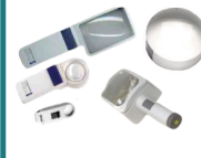
Lupa de mano