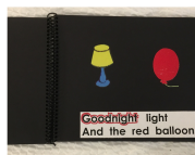
Aplicaciones de texto con respaldo de imágenes

Los apoyos auditivos, como la escucha de libros, pueden utilizarse con cualquier medio de aprendizaje.